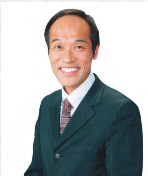
講師 東国原英夫氏 (前宮崎県知事)

本講演会では、幾度となく廻り来る試練や逆境をその都度独自の発想と努力により力強く乗り越えてこられた「東国原英夫氏」の人生観や生き方について「楽しく」そして「熱く」語っていただきます。